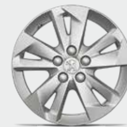
16"-os TARANAKI könnyűfém keréktárcsa