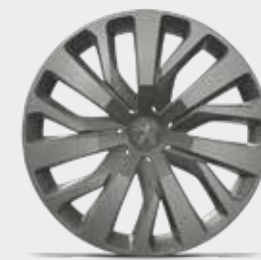
16"-os TONGARIRO dísz tárcsa