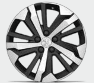
17"-os AORAKI gyémántcsiszolt könnyűfém keréktárcsa