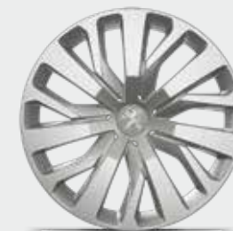
16"-os RAKIURA dísz tárcsa

* Változattól függően széria-, opciós vagy nem rendelhető felszerelés