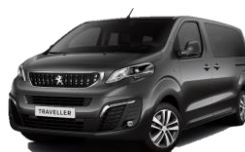
M0VL - Szürke PLATINUM