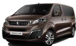
M0G6 - Barna RICH OAK