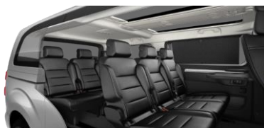
CYFX - Fekete "Claudia" bőrkárpit