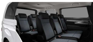
44FZ - Kék CRAN szövetkárpit (Family csomagban)