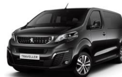
M09V - Fekete PERLA NERA

Az itt megjelenített képek illusztrációk.