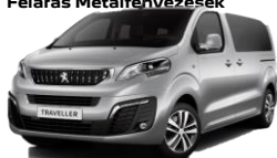
M0F4 - Szürke ARTENSE