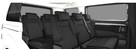
43FT - Több tónusú "Mica" szövetkárpit (széria)