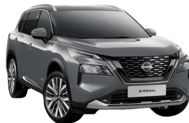
Gyöngyházzsürke KBY – 250 000 Ft