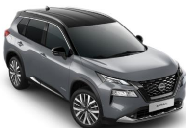
Gyöngyházzsürke - Fekete XEX – 450 000 Ft