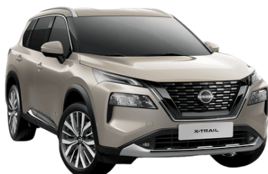
Pezsgőezüst KAY – 250 000 Ft