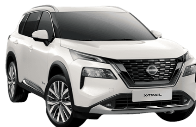
Gyöngyházfehér QBE – 250 000 Ft