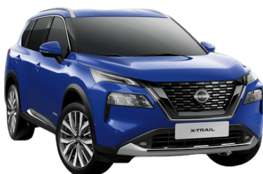
Kék RBV – 210 000 Ft