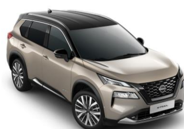
Pezsgő ezüst - Fekete XEW – 450 000 Ft