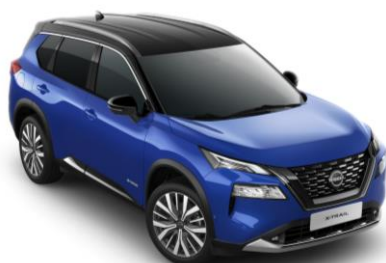
Kék - Fekete XEU – 410 000 Ft