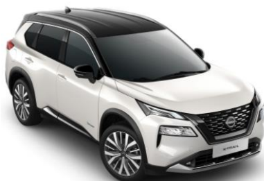
Gyöngyházfehér - Fekete XKJ – 450 000 Ft