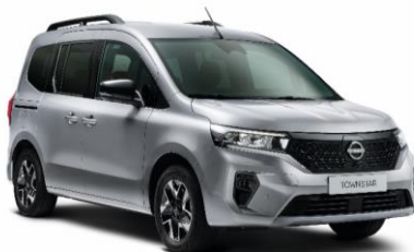
Gyöngyház szürke KQA – 130.000 Ft