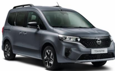
Szürke KPW – 70.000 Ft