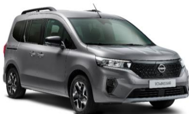
Casiopee Szürke KNG – 130.000 Ft