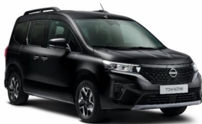
Enigma fekete GNE – 130.000 Ft