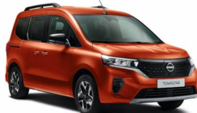
Terrakotta CNZ – 130.000 Ft