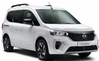
Fehér QNG – 0 Ft