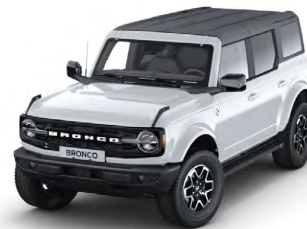
Oxford White Alapfényezés