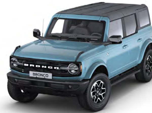
Area 51 Prémium fényezés*