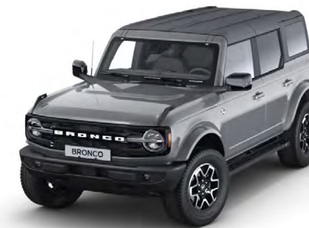
Carbonized Grey Metál karosszériafehérítés*