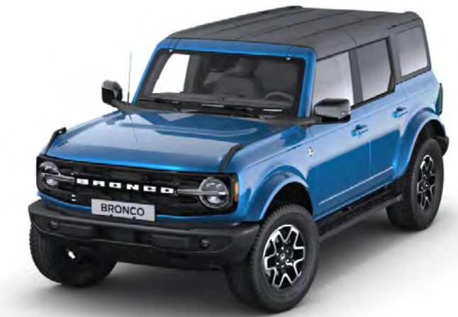
Velocity Blue Metál karosszériafehérítés*