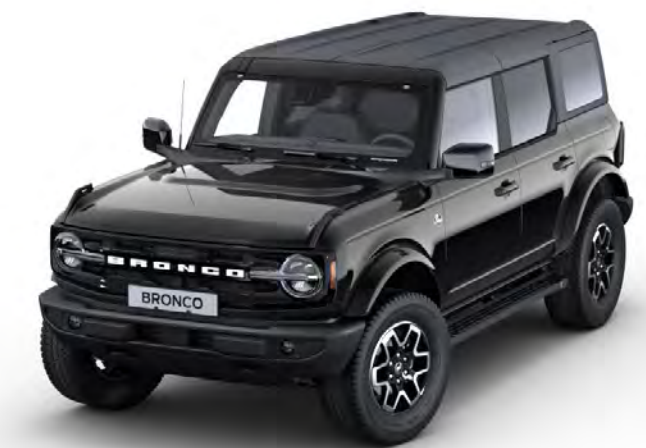
Absolute Black Metál karosszériafehérítés*