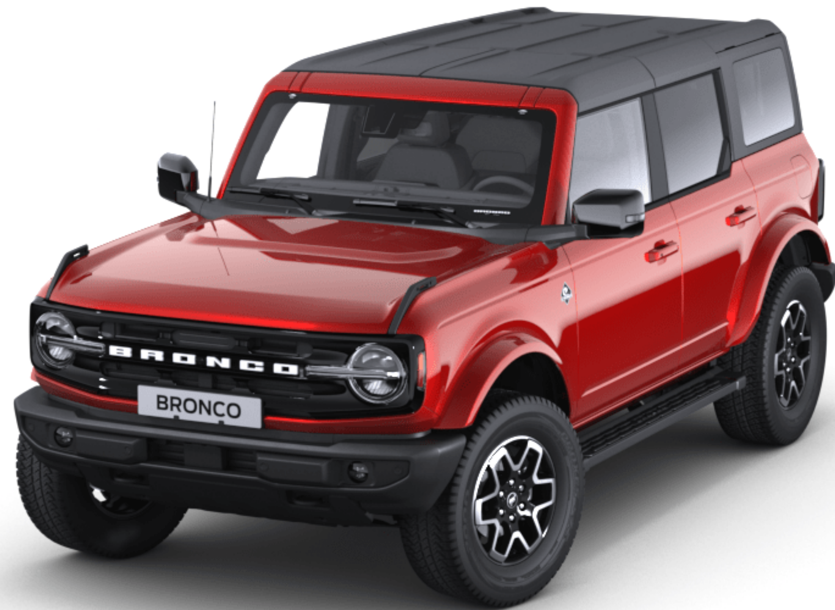
Hot Pepper Red Színezett átlátszó metál karosszériafehérítés*

A Ford Bronco speciális, többlépcsős fényezési eljárásnak köszönheti tartós külsejét. A viaszos üregvédelemmel ellátott acél karosszériaelemek, a fedőlakkréteg nyújtotta védelem és a felhordási eljárások biztosítják, hogy új Bronco járműve még sok évig megőrizze vonzó külsejét.