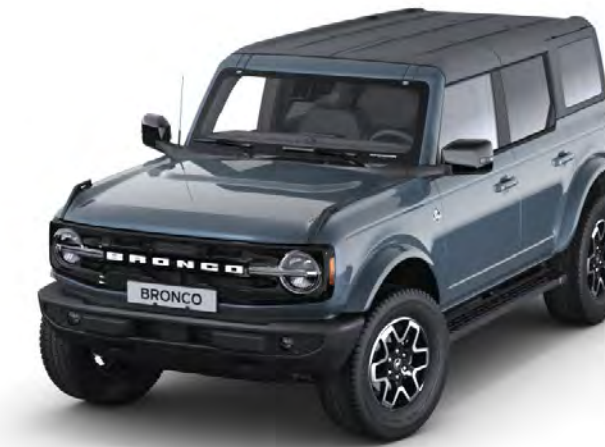
Azure Grey Metál karosszériafehérítés*