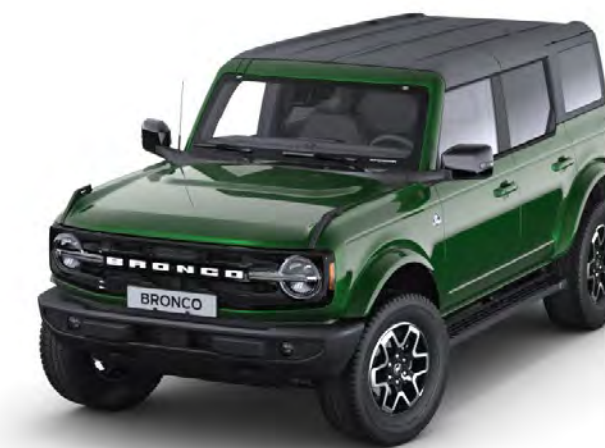
Eruption Green Metál karosszériafehérítés*