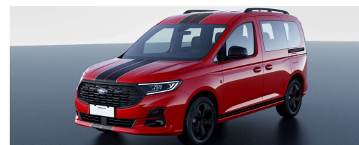
Sport Standard felszereltség Titanium szérián felül

17" x 6,5 "Premium" árnyaltszürke könnyűfém kerekek - 215/55 R17-es gumikkal