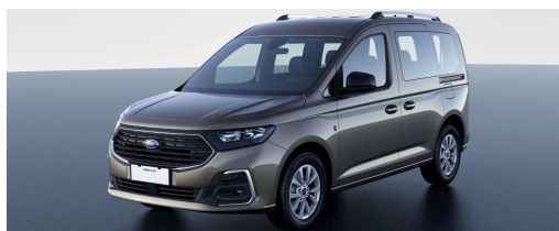
Titanium Standard felszereltség

2023.75-ös modellév 2023/2 Érvényes: 2023. június 19-i gyártástól A változtatás jogát fenntartjuk!