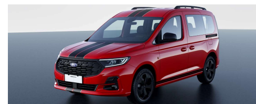
Sport Standard felszereltség Titanium szérián felül