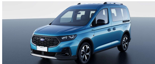
Active Standard felszereltség Titanium szérián felül