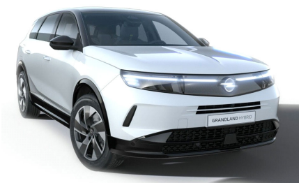
Arktis fehér (alapfényezés)