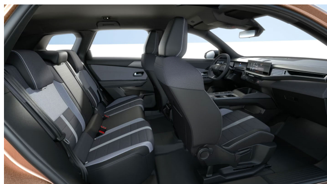
Édition kárpit, szövet, fekete/szürke (CBFR)