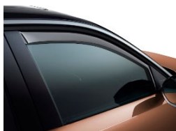
Légterelő első ajtóra, 2db-os szett