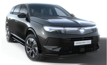
Karbon fekete (metálfényezés)