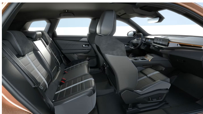
Bőrkárpit, perforált nappabőr, fekete (8BFC)