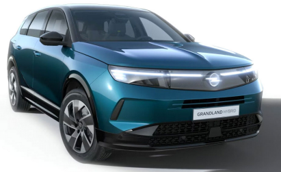
Spektrum zöld (metálfényezés)