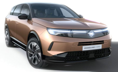
Impakt réz (metálfényezés)