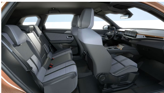
GS kárpit, szövet, sötétszürke/fekete (CBFT)