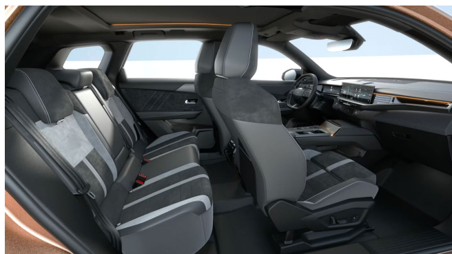
Alcantara kárpit, fekete (1UFX)