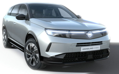
Kristall ezüst (metálfényezés)