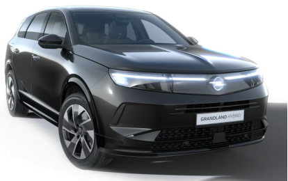
Karbon fekete (metálfényezés)