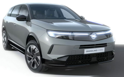
Grafik szürke (alapfényezés)