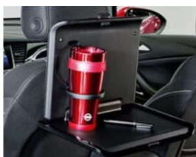
2 pohártartós asztalka 2 moduláris csatlakozó