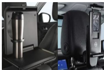
1 asztalka + 1 univerzális tablet tartó + 2 csatlakozó