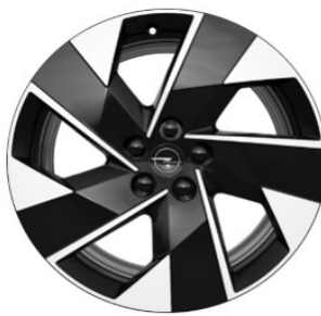
DZHL8 / DMI39