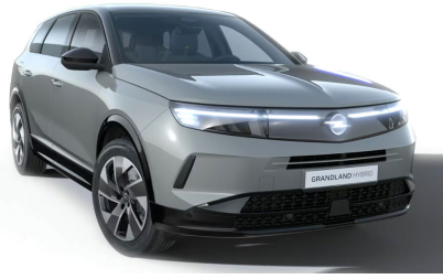
Grafik szürke (alapfényezés)