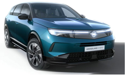
Spektrum zöld (metálfényezés)