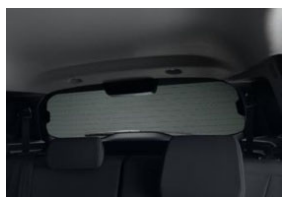
Sötétítő hátsó ablakra