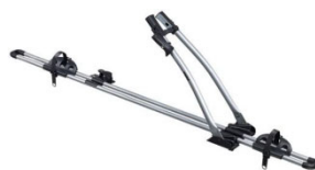
Freeride 532 1-db-os kerékpártartó