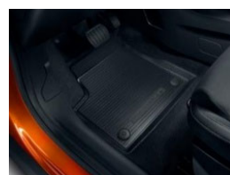
Gumiszőnyeg garnitúra első és hátsó