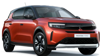
Kanyon narancs (metálfényezés)