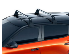
Keresztirányú tetőrudak (tetősín nélküli járműre)