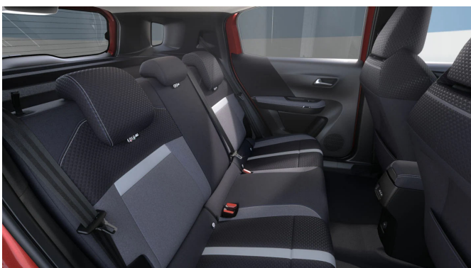
Gap kárpit, szövet, szürke/fekete (BMFR)