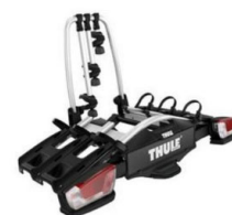
Coach 276 3 db-os bicikli tartó