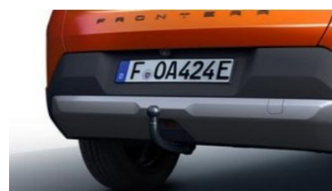
Szerszám nélkül leszerelhető vonóhorog (5 személyes kivitelhez, 17768 gyártástól)