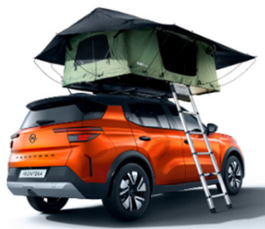
2 személyes tetősátor