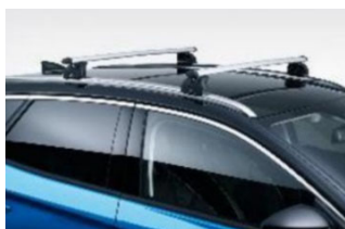
Keresztirányú tetőrudak hosszanti tetősínhez