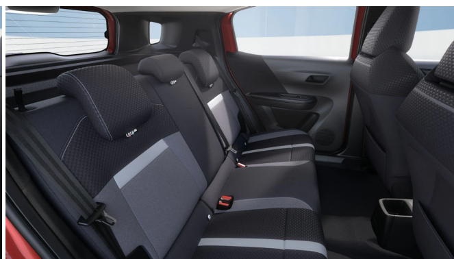
Gap kárpit, szövet, szürke/fekete (BMFR)