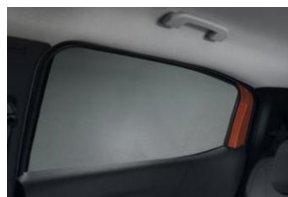
Sötétítő hátsó oldalsó ablakokra 2 db-os