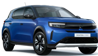
Effekt kék (metálfényezés)