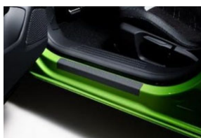
Küszöb védő borítás, 2db-os szett