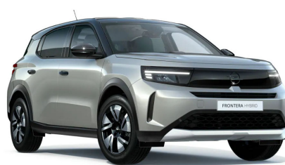
Kristall ezüst (metálfényezés)