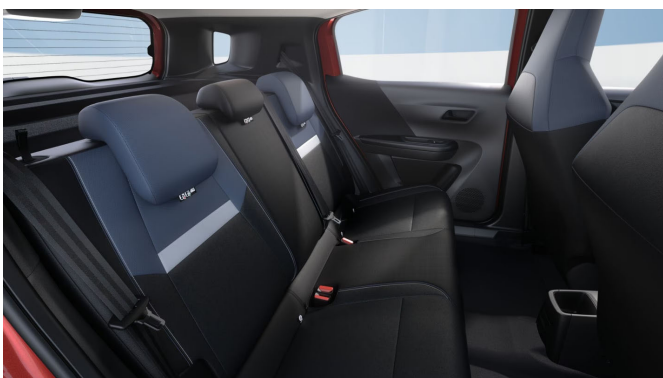
Riáz kárpit, szövet, kék/fekete/sötétszürke (BLFX)