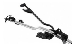
Expert 298 1-db-os kerékpártartó