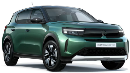
Terep zöld (metálfényezés)