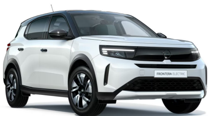
Arktis fehér (alapfényezés)