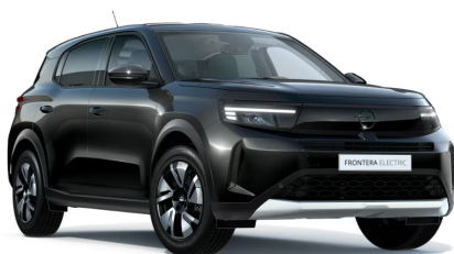
Karbon fekete (metálfényezés)