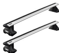
Corsa F-hez keresztirányú tetőrudak: