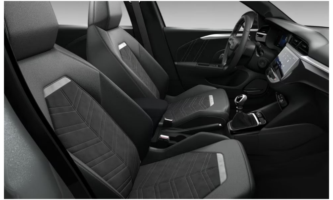
Alcantara kárpit, alcantara, fekete (1UFX)