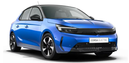
Hűségkék (limitált metálfényezés)