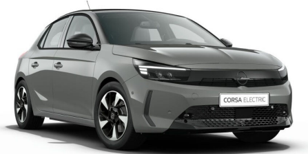
Grafik szürke (alapfényezés)