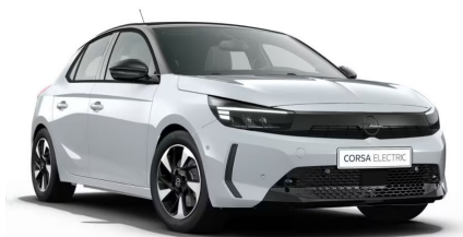
Kontur fehér (metálfényezés)