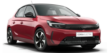
Kardio vörös (metálfényezés)