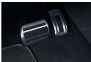
Rozsdamentes acél pedálborítás: 2 pedál