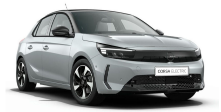
Kristall ezüst (metálfényezés)