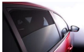
Hátsó és hátsó oldalsó árnyékoló szett