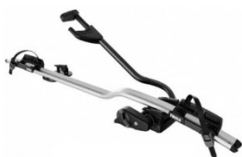
Expert 298 1-db-os kerékpártartó