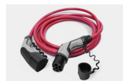
22 kW, 3 fázisú Type 2 kábel