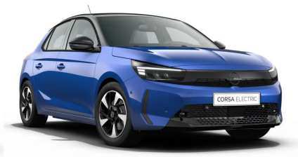
Voltaik kék (metálfényezés)