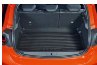
Csúszásgátló csomagterértálca megemelt szegéllyel