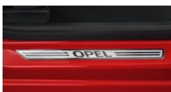
Első alumínium hatású Opel küszöbborítás