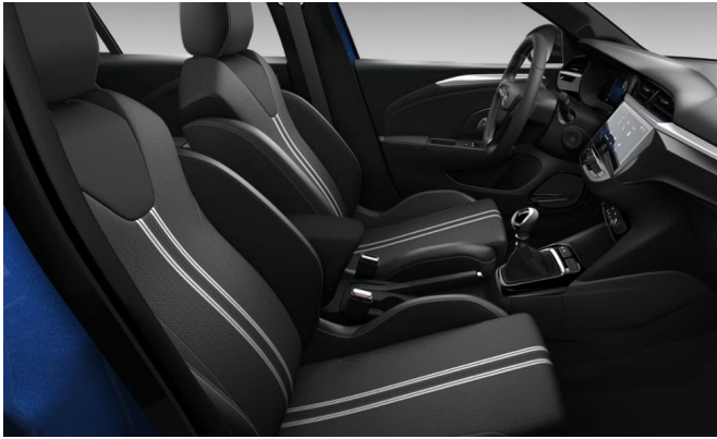
Banda kárpit, szövet, fekete és fehér (D4FV)