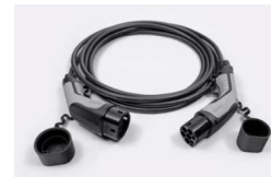
7,4 kW, 1 fázisú Type 2 kábel