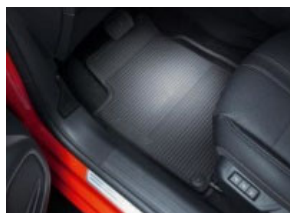
Négyévszakos szőnyeg garnitúra