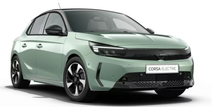
Reményzöld (limitált metálfényezés)