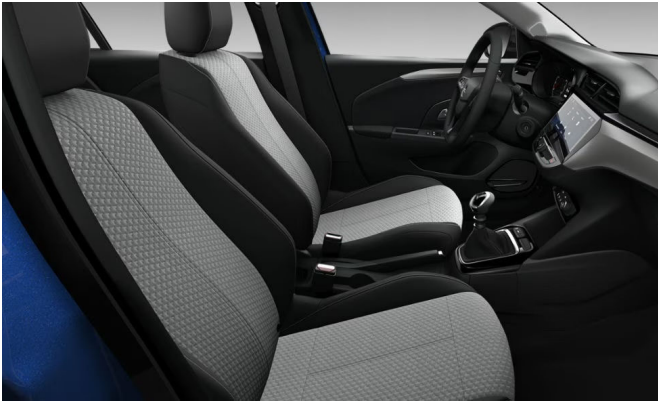
Fresez kárpit, szövet, fekete (BPFX)