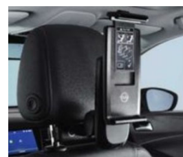
2 univerzális tablet tartó 2 moduláris csatlakozó