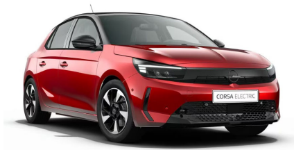
Vágyvörös (limitált metálfényezés)