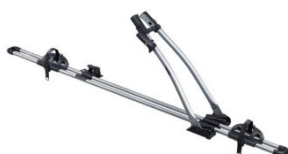
Freeride 532 1-db-os kerékpártartó