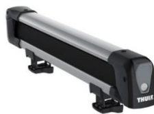
Snowpack 7324 tartó: 4 db síléc / 2 db snowboard