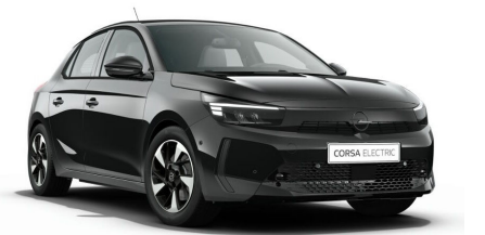
Karbon fekete (metálfényezés)