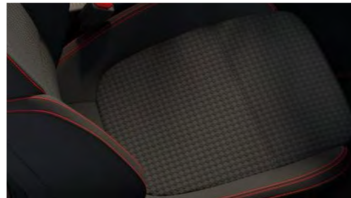
Eton Black színben/Eton Black színben, Generic Red díszítéssel ST-Line alapfelszereltség