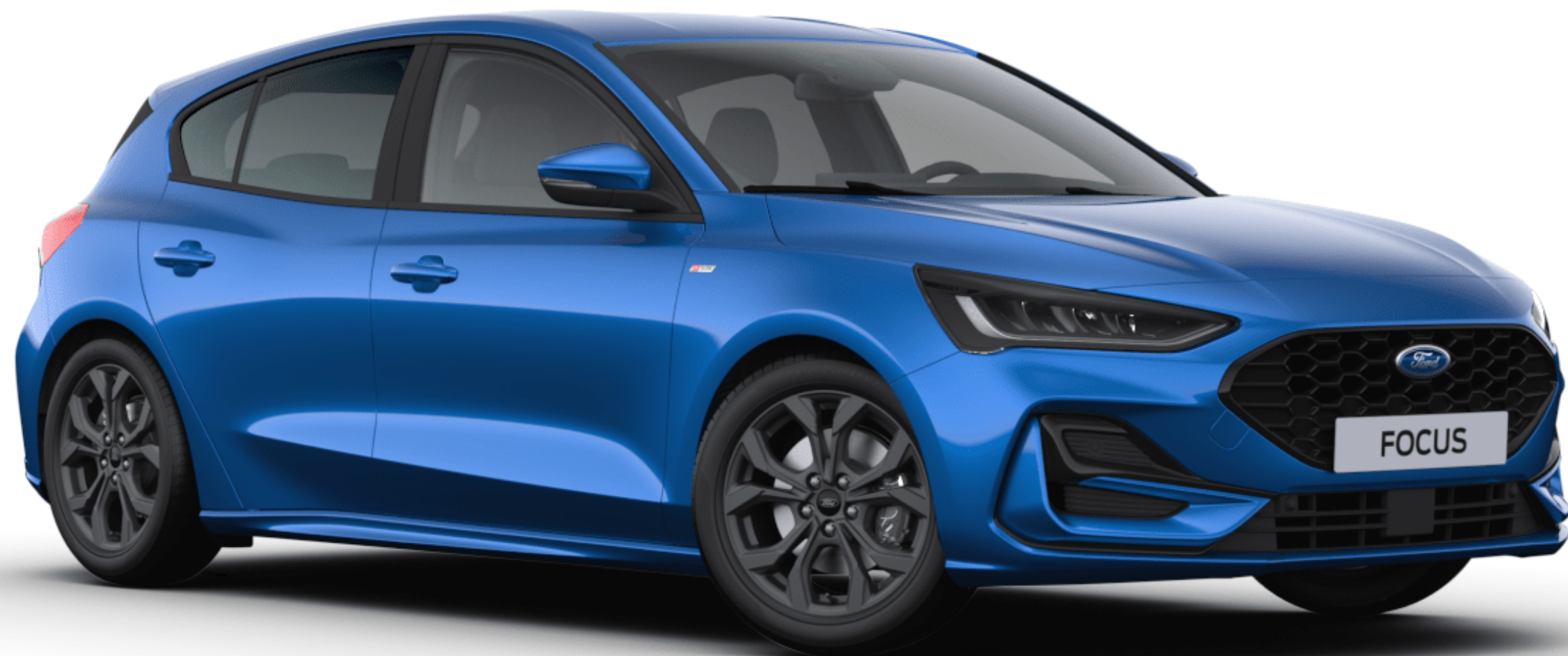
Desert Island Blue Metál karosszériafényezés*

A Ford Focus speciális, többlépcsős fényezési eljárásnak köszönheti tartós külsejét. A viaszos üregvédelemmel ellátott acél karosszériaelemek, a fedőlakkréteg nyújtotta védelem és a felhordási eljárások biztosítják, hogy új Focus járműve még sok évig megőrizze vonzó külsejét.