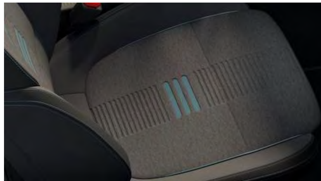
Nunatak Nordic Blue színben/Eton Black színben (nem elérhető)