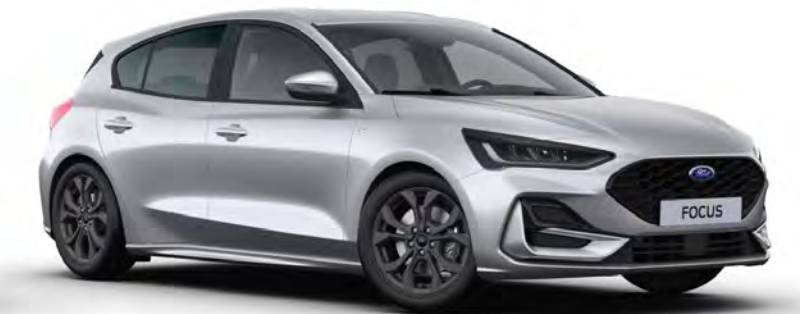
Moondust Silver Metál karosszériafényezés*