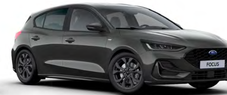
Magnetic Metál karosszériafényezés*