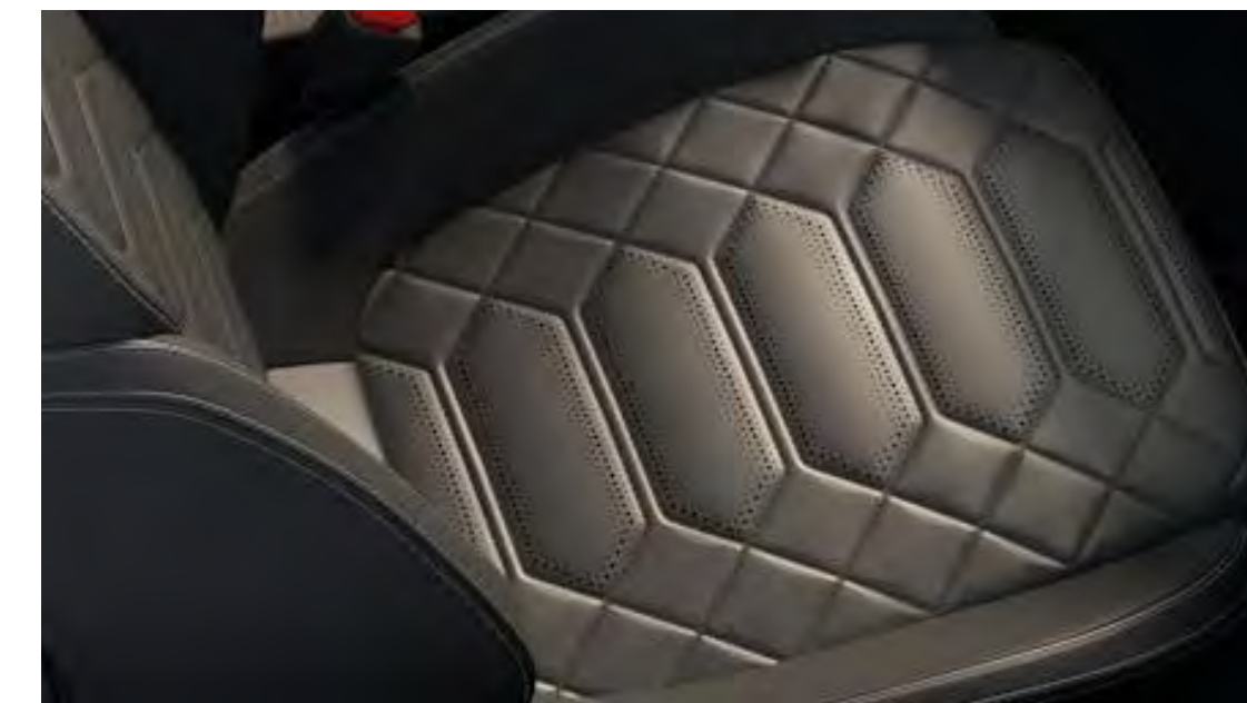
Captain Black színben/Feeltek Ebony színben (Sensico® Metal Grey varrással) (nem elérhető)