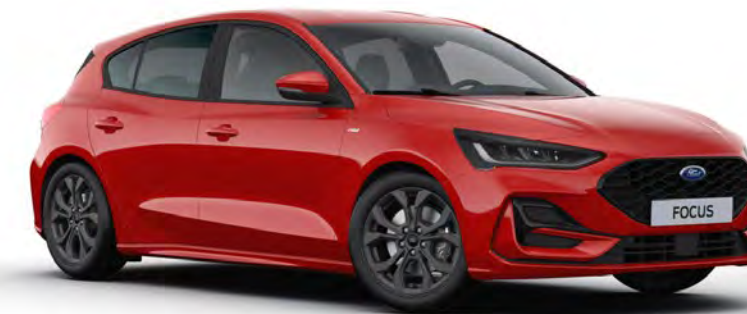
Race Red Alapszín