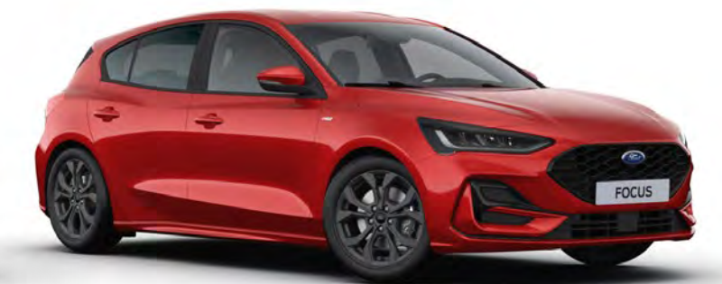
Fantastic Red Prémium metál karosszériafényezés*