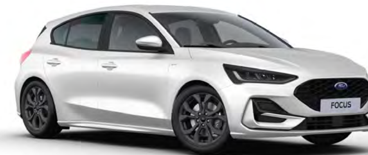
Frozen White Alapszín