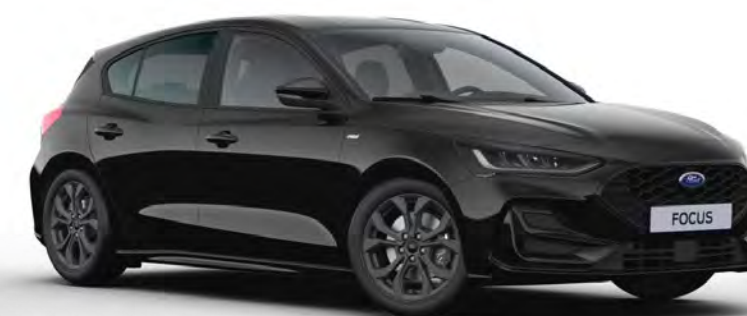
Agate Black Metál karosszériafényezés*