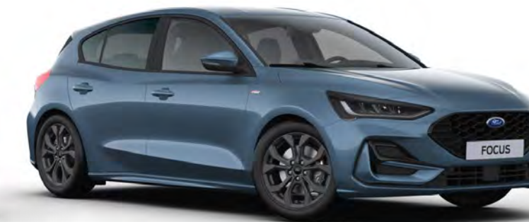
Blue Metallic Metál karosszériafényezés*