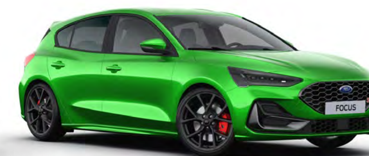
Mean Green Exkluzív karosszériafényezés* (csak ST)