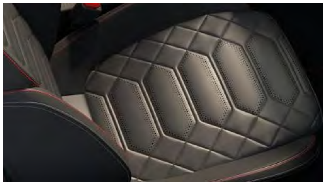
Captain Black színben/Feeltek Ebony színben (Sensico® Generic Red varrással) (nem elérhető)