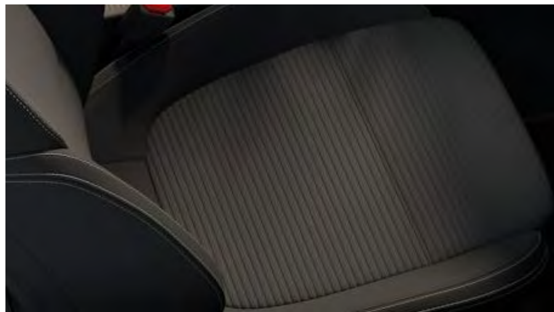
Eton Black színben/Eton Black színben Titanium alapfelszereltség