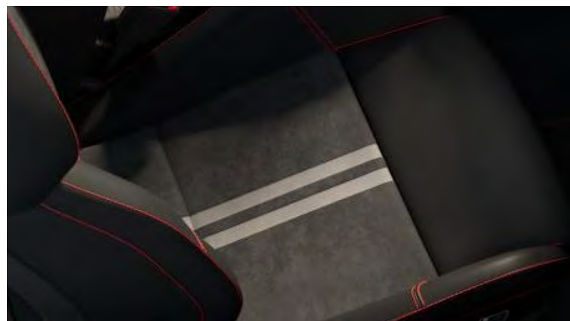
Feeltek/Cuir Vinyl Ebony színben/Cuir Vinyl Ebony színben, Generic Red varrással, Sensico® üléspárnákkal ST alapfelszereltség

Megjegyzés: A Sensico® a Ford EU védjegye az autók belteréhez kifejlesztett prémium szintetikus kárpit jelölésére. Vegán kárpit, amely a prémium, lágy érzetet ötvözi a tartóssággal és nagyszerű megjelenéssel. Karbantartása egyszerű, könnyen tisztítható és védhető a foltokkal és szagokkal szemben. Minőségi megjelenésével a Sensico® nem csupán kényelmes ülést biztosít a hosszú utazások során, de nyugodt lelkiismeretet is, mivel nem állati eredetű. A modern, ambíciózus autóvezetőknek tervezett gondtalanságot képviseli.