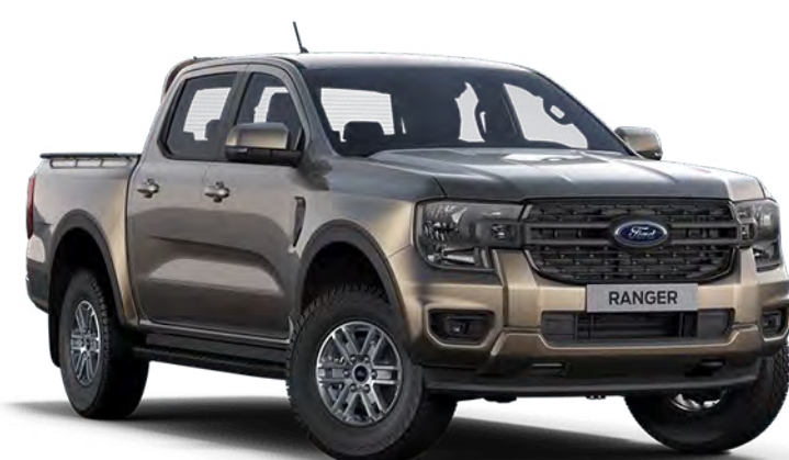
Diffused Silver ††† Metálfényezés