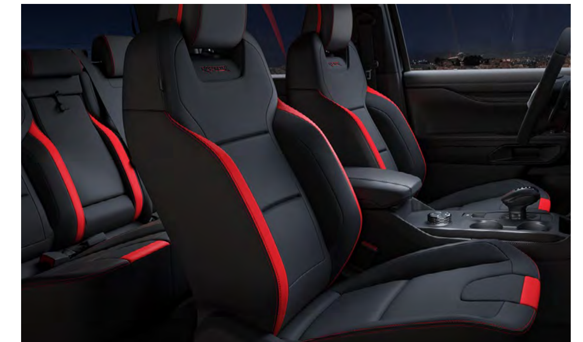
Super Matte bőr és Dinamica Auto Miko hasított bőr Ebony színben (Code Orange kiemeléssel) Alapfelszereltség a Raptor szérián

Megjegyzés: A Sensico® a Ford EU védjegye az autók belteréhez kifejlesztett prémium szintetikus kárpit jelölésére. Vegán kárpit, amely a prémium, lágy érzetet ötvözi a tartósággal és nagyszerű megjelenéssel. Karbantartása egyszerű, könnyen tisztítható és védhető a foltokkal és szagokkal szemben. Minőségi megjelenésével a Sensico® nem csupán kényelmes ülést biztosít a hosszú utazások során, de nyugodt lelkiismeretet is biztosít, mivel nem állati eredetű. A modern, ambíciózus autóvezetőknek tervezett gondtalanságot képviseli.