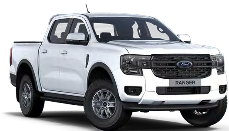
Frozen White †† Alapfényezés

A Ford Ranger tartós külsejét egy speciális, többlépcsős fényezési eljárásnak köszönheti. A viasszal kezelt acél karosszériaelemek, a védő fedőréteg és a felhordási eljárások hozzájárulnak ahhoz, hogy új Rangerje hosszú éveken át megőrizze kitűnő megjelenését.