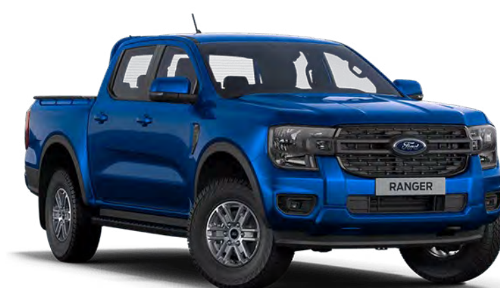
Blue Lightning † Metálfényezés