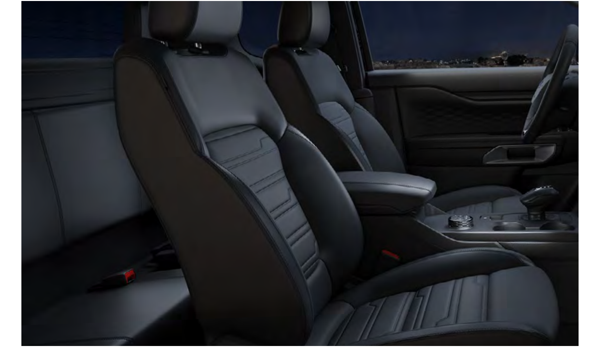
Soho bőr (Apex-dombornyomott) Ebony színben Alapfelszereltség a Limited szérián