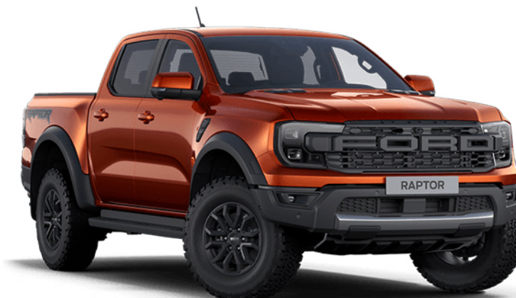
Sedona Orange † Metálfényezés