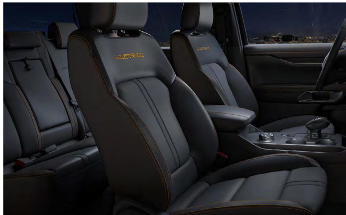
Embossed bőr (Microrib-dombornyomott) Ebony színben Alapfelszereltség a Wildtrak szérián