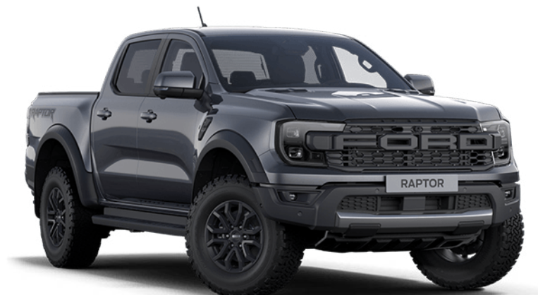
Meteor Grey † Metálfényezés

A Ford Rangerre az első forgalomba helyezéstől számított 12 évig érvényes a Ford Átrozsdásodás elleni garancia. A felhasználási feltételek érvényesek.