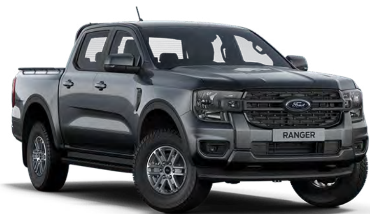
Carbonized Grey †† Fashion metálfényezés