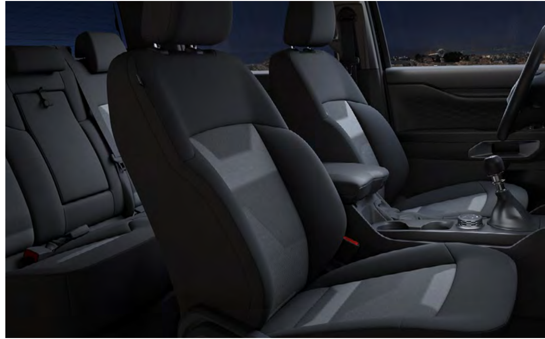
Ascent szövet Ebony színben Alapfelszereltség az XL szérián