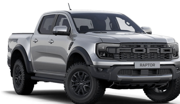
Aluminium Metallic † Fashion metálfényezés