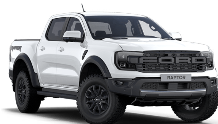
Arctic White † Alapfényezés