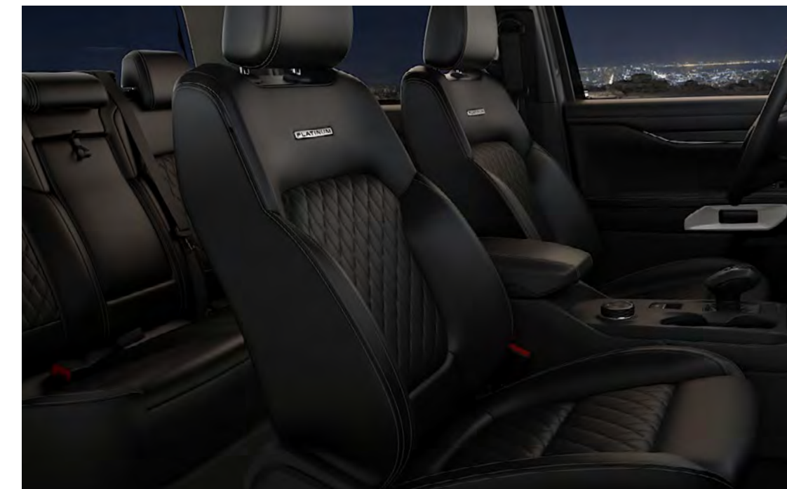
Prémium bőr – Quilt/Embellish Ebony színben Alapfelszereltség a Platinum szérián