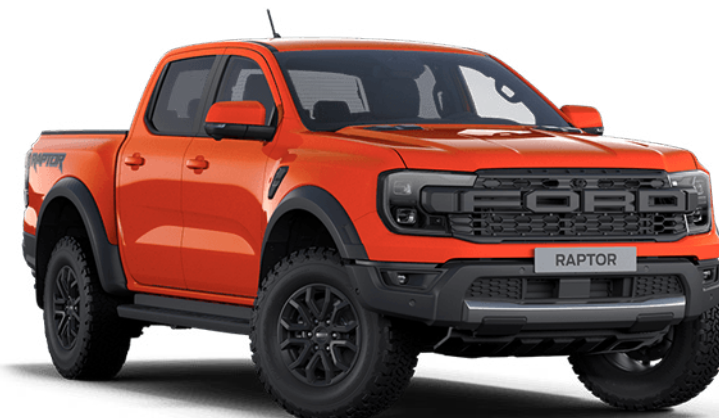
Code Orange † Alapfényezés