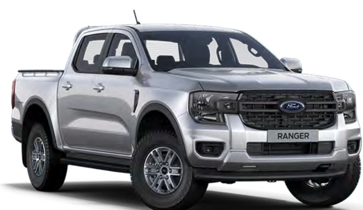
Moon dust Silver †† Metálfényezés