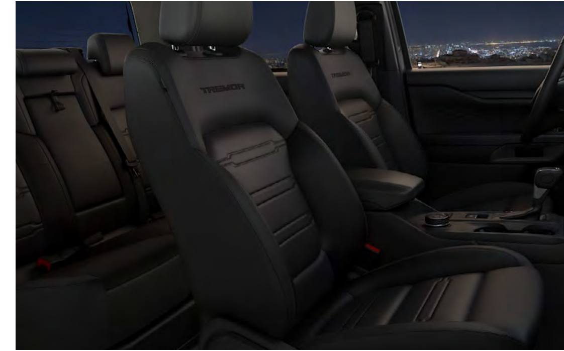
Vinyl/szövet – Soho Emboss betéttel, Ebony színben Alapfelszereltség a Tremor szérián