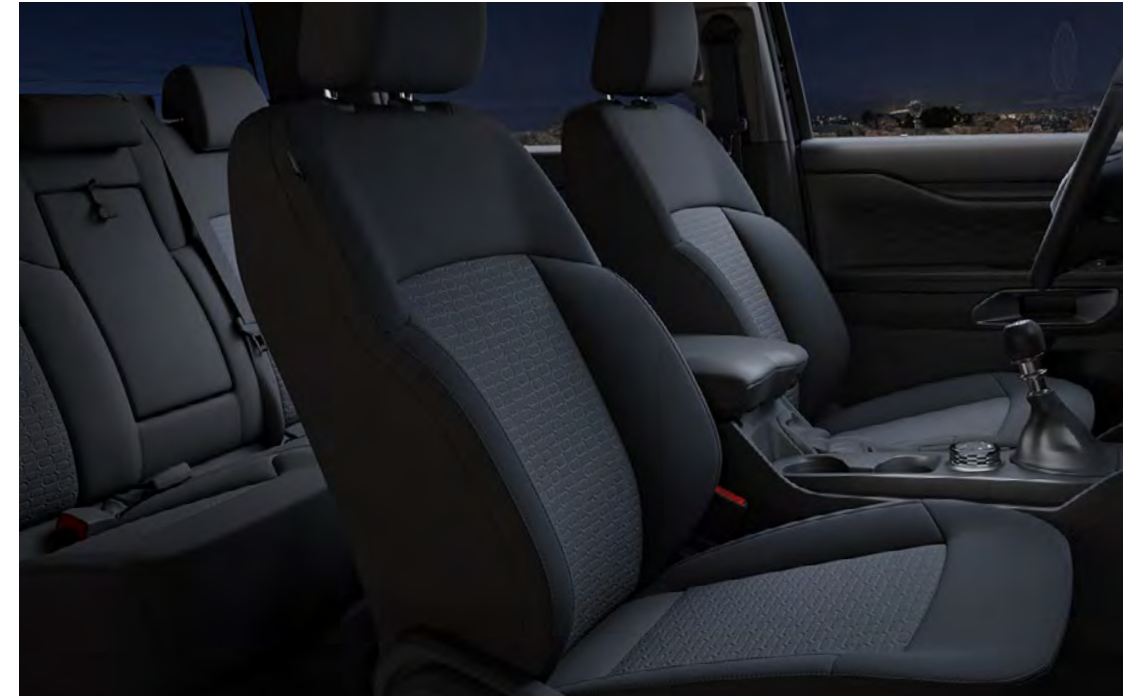
Elevate Embossed szövet Ebony színben Alapfelszereltség az XLT szérián