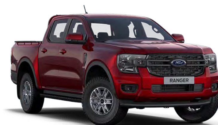
Lucid Red †† Fashion metálfényezés