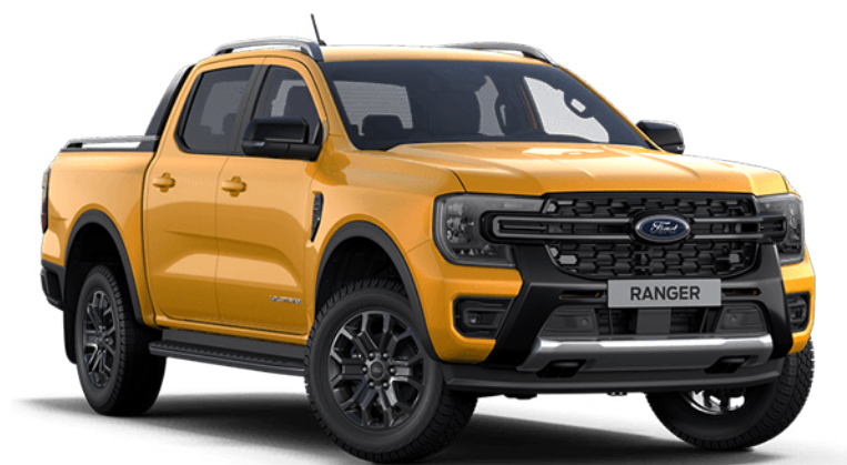
Cyber Orange †† Fashion metálfényezés