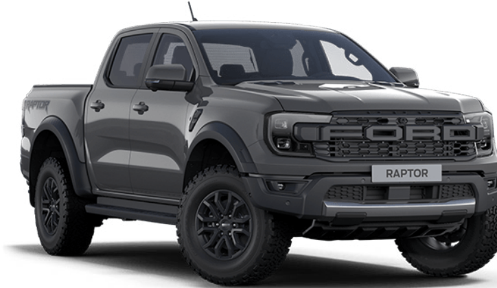
Conquer Grey ††† Alapfényezés