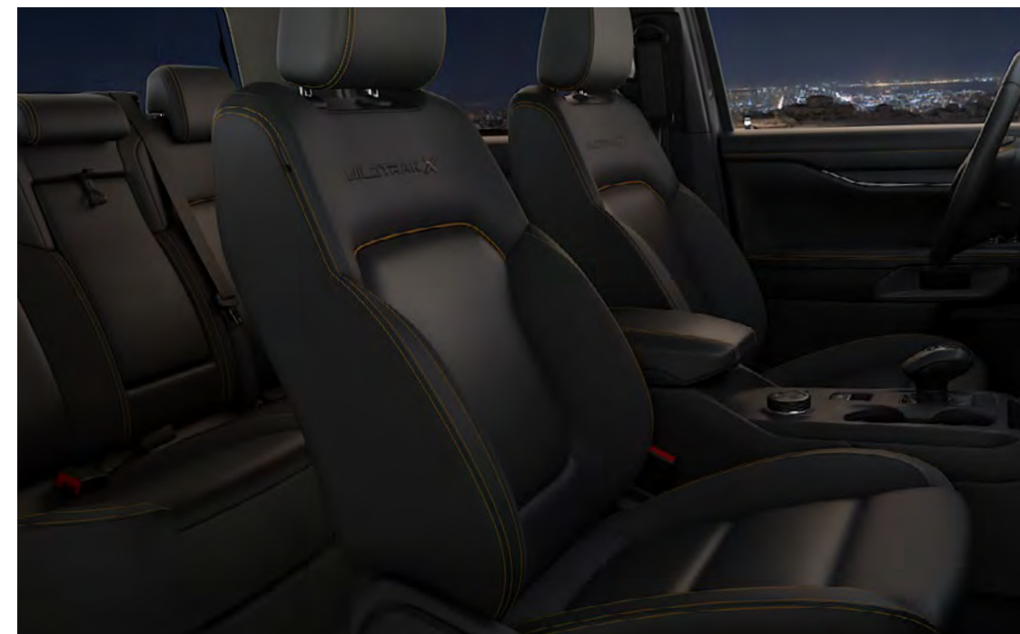
Részben bőr – Soho Ebony színben Alapfelszereltség a Wildtrak X szérián