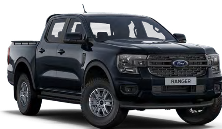
Agate Black †† Metálfényezés