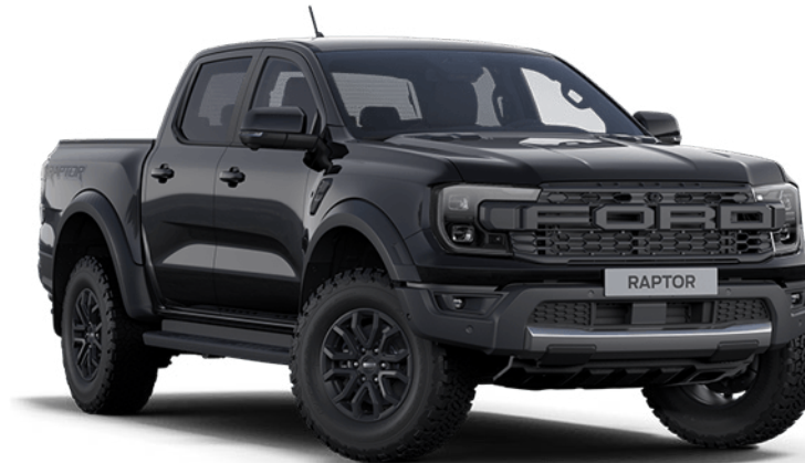
Absolute Black † Metálfényezés