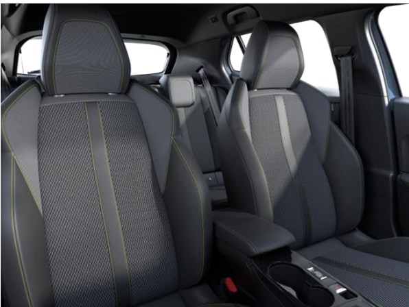
BELOMKA bőr-szövetkárpit 'adamite' díszvarrással GT széria