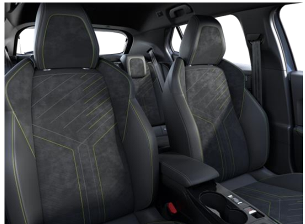
Alcantara ICONIUM kárpit 'adamite' díszvarrással GT opció